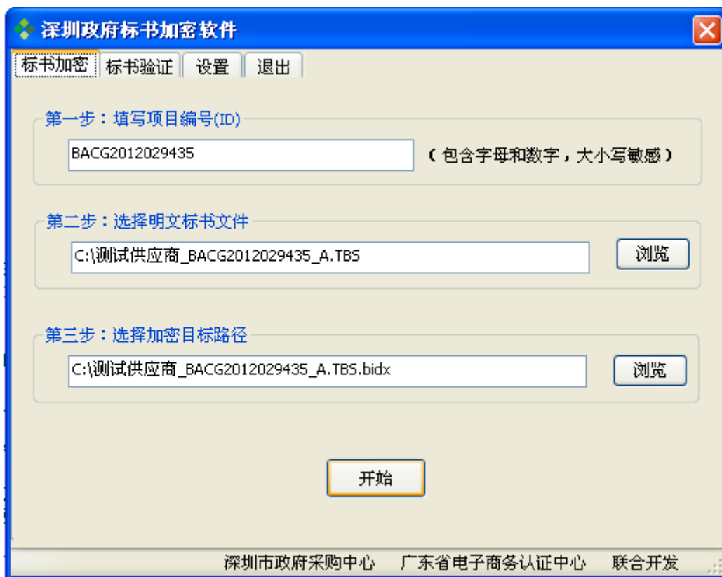
(图 1: 标书加密)

19.1 . 在投标文件制作完成后, 投标书编制软件自带的加密程序能自行对其进行加密, 投标人无须用其它加密方式。此加密程序确保投标文件在到达投标截止时间后才能解密查看。在加密过程中, 加密软件会根据项目信息自动获取对应项目的加密规则文件, 如下图所示: